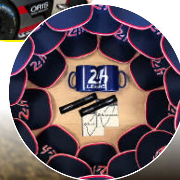
Welcome pack catalogue sur demande