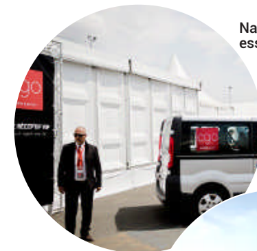
Navette privée : essais ou course