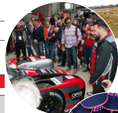
Accès Paddock Pitwalk/Gridwalk