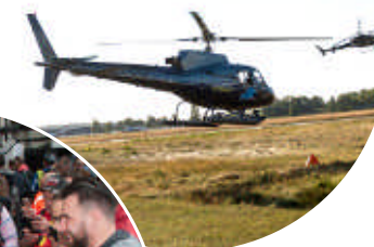
Survol en hélicoptère